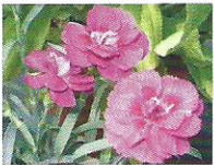
Kartäusernelken 6 - 9