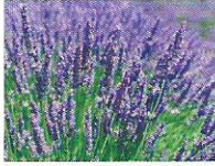
Lavendel 5 - 8