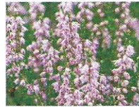
Schneeheide 8 - 11