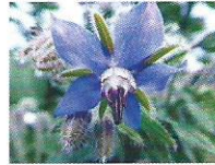
Borretsch 6 - 9