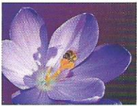
Honigkrokus 3 - 5

Vermeiden Sie „Modepflanzen“ wie z. B. Süßkartoffel, Pfeifenputzer, Bambus etc. Diese haben ökologisch keinen Wert und verbrauchen nur den Platz!