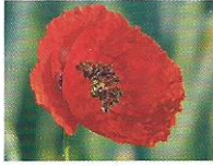
Mohn 5, 6