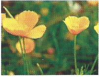
Kalifornischer Mohn 6 - 11