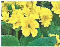
Primel 3, 4