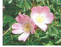
Wildrose 6 - 8