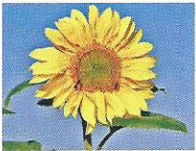
Sonnenblume 6 - 8