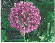
Schmucklauch 5 - 8