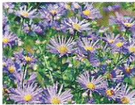
Herbstastern 8 - 11