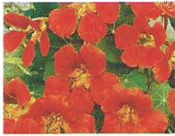
Kapuzinerkresse 7 - 9