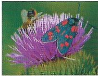
Disteln 6 - 8