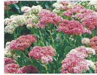
Fetthenne 6 - 9