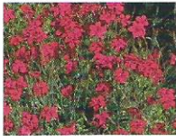
Heidenelken 6 - 9