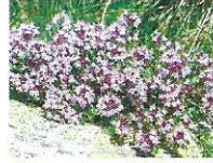
Thymian 5 - 10