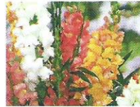
Löwenmäulchen 6 - 9