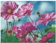
Cosmea 8 - 11