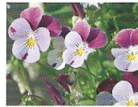
Ackerveilchen 4 - 7