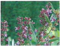
Salbei 6 - 9